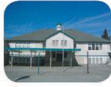
27 Nelson Elementary 4850 Irmin St. Burnaby, BC V5J 1Y2