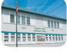
7 Capitol Hill Elementary 350 S. Holdom Ave. Burnaby, BC V5B 3V1