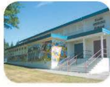
33 Sperling Elementary 2200 Sperling Ave. Burnaby, BC V5B 4K7