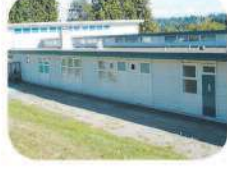
16 Gilpin Elementary 5490 Eglinton St. Burnaby, BC V5G 2B2