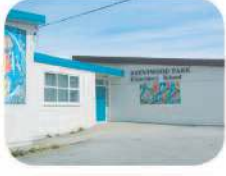
4 Brentwood Park Elementary 1455 Delta Ave. Burnaby, BC V5B 3G4