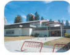
37 Taylor Park Elementary 7590 Mission Ave. Burnaby, BC V3N 5C7