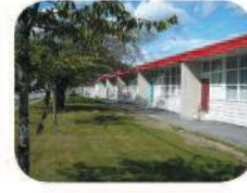
40 Westridge Elementary 510 Duncan Ave. Burnaby, BC V5B 4L9