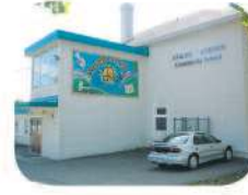
35 Stride Avenue Community Elementary 7014 Stride Ave. Burnaby, BC V3N 1T4