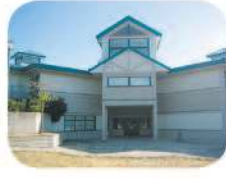
32 South Slope Elementary 4446 Watling St. Burnaby, BC V5J 5H3