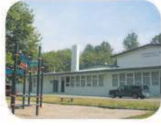
11 Confederation Park Elementary 4715 Pandora St. Burnaby, BC V5C 2C2