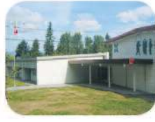
28 Parkcrest Elementary 6055 Halifax St. Burnaby, BC V5B 2P4