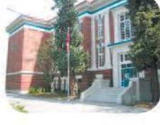
15 Gilmore Community Elementary 50 S. Gilmore Ave. Burnaby, BC V5C 4P5