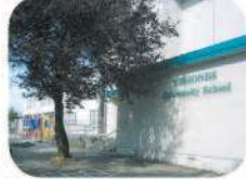
13 Edmonds Community Elementary 7651 18th Ave. Burnaby, BC V3N 1J1