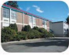
25 Montecito Elementary 2176 Duthie Ave. Burnaby, BC V5A 2S2