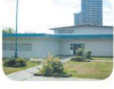
6 Cameron Elementary 9540 Erickson Dr. Burnaby, BC V3J 1M9