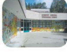
14 Forest Grove Elementary 8525 Forest Grove Dr. Burnaby, BC V5A 4H5