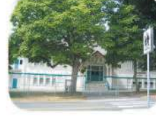
19 Kitchener Elementary 1351 S. Gilmore Ave. Burnaby, BC V5C 4S8