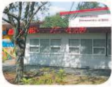
1 Armstrong Elementary 8757 Armstrong Ave. Burnaby, BC V3N 2H8