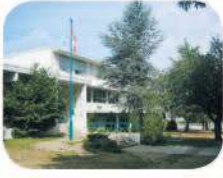
23 Marlborough Elementary 6060 Marlborough Ave. Burnaby, BC V5H 3L7