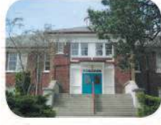
12 Douglas Park Elementary 4861 Canada Way Burnaby, BC V5G 1L7