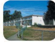
36 Suncrest Elementary 3883 Rumble St. Burnaby, BC V5J 1Z5