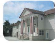
41 Windsor Elementary 6166 Imperial St. Burnaby, BC V5J 1G5