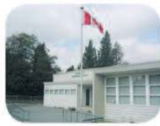
26 Morley Elementary 7355 Morley St. Burnaby, BC V5E 2K1