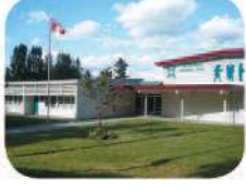
5 Buckingham Elementary 6066 Buckingham Ave. Burnaby, BC V5E 2A4