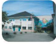
31 Second Street Community Elementary 7502 Second St. Burnaby, BC V3N 3R5