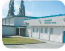
30 Seaforth Elementary 7881 Government Rd. Burnaby, BC V5A 2C9