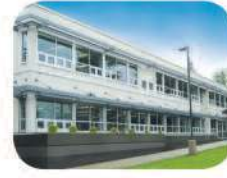
39 University Highlands Elementary 9388 Tower Road Burnaby, BC V5A 4X6