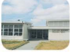
8 Cascade Heights Elementary 4343 Smith Ave. Burnaby, BC V5G 2V5