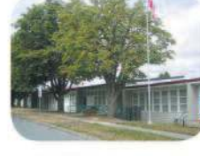
18 Inman Elementary 3963 Brandon St. Burnaby, BC V5G 2P6