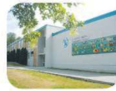
34 Stony Creek Community Elementary 2740 Beaverbrook Cr. Burnaby, BC V3J 7B6