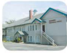
29 Rosser Elementary 4375 Pandora St. Burnaby, BC V5C 2B6