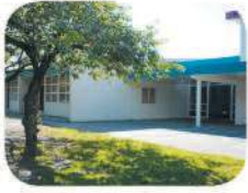
2 Aubrey Elementary 1075 Stratford Ave. Burnaby, BC V5B 3X9