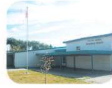
38 Twelfth Avenue Elementary 7622 12th Ave. Burnaby, BC V3N 2K1