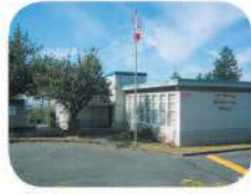
10 Clinton Elementary 5858 Clinton St. Burnaby, BC V5J 2M3