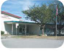
24 Maywood Community Elementary 4567 Imperial St. Burnaby, BC V5J 1B7