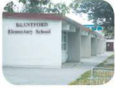
3 Brantford Elementary 6512 Brantford Ave. Burnaby, BC V5E 2S1