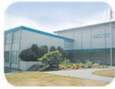
9 Chaffey-Burke Elementary 4404 Sardis St. Burnaby, BC V5H 1K7