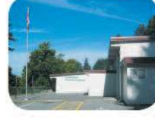
17 Glenwood Elementary 5787 Marine Dr. Burnaby, BC V5J 3H1